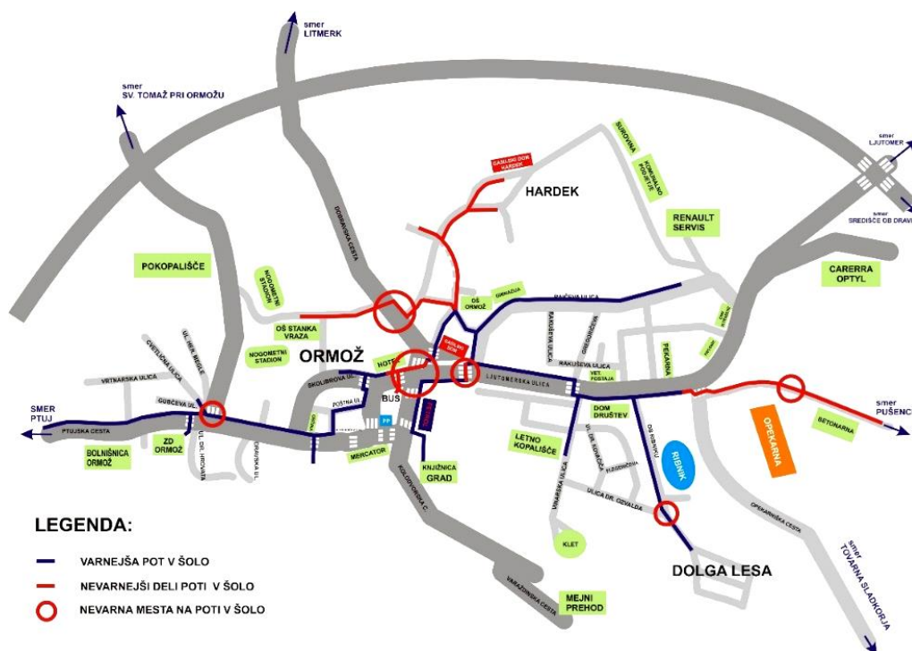
Skica 1: Načrt varne poti v šolo

Vloga načrta varne poti v šolo je zagotoviti varno okolje otrokom na poti v šolo in med bivanjem v šoli. Nastal je na podlagi pregleda poti, ki peljejo proti šoli, mnenja staršev in učencev. Pri izdelavi načrta varnih poti je sodelovala policijska postaja Ormož in SPV Ormož. Varnejša pot v šolo je na karti označena z modro barvo in je le varnejša, kar pomeni, da vseeno ni popolnoma varna, saj promet kot dinamičen proces prinaša neprestano nove prometne situacije, ki so lahko na še tako varni poti nevarne. Z rdečo barvo so na karti označeni odseki poti, kjer je nevarnost večja. Nevarni deli so: cesta proti Pušencem, pot proti glasbeni šoli in pot od osnovne šole proti Hardeku.