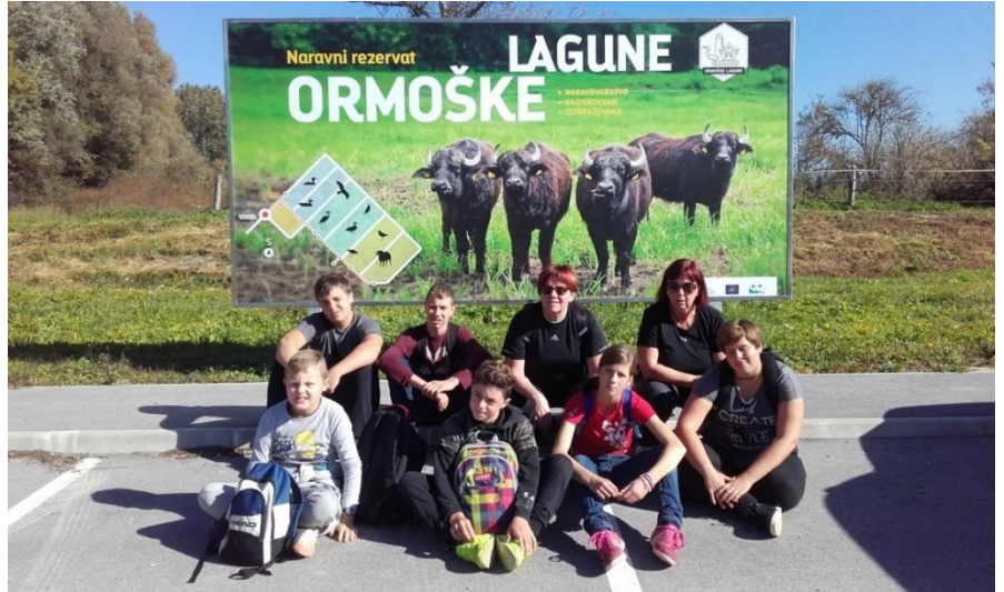
Učenci 5., 6., 9. razreda